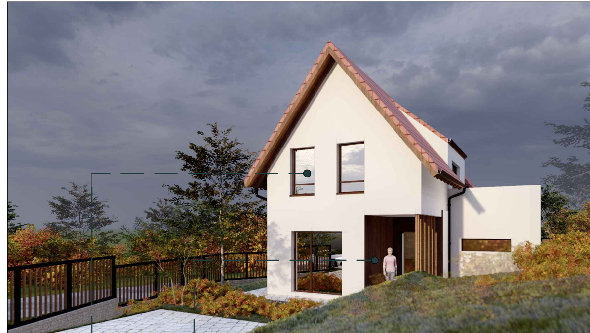
PERSPECTIVĂ DE ANSAMBLU FAȚADA PRINCIPALĂ