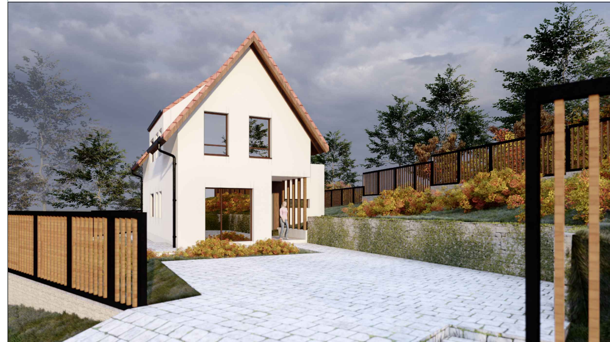
PERSPECTIVĂ DE ANSAMBLU FAȚADA PRINCIPALĂ