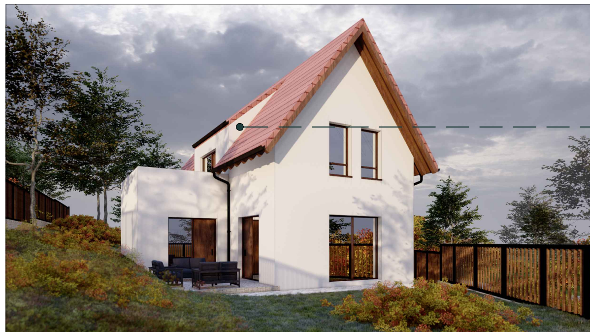
PERSPECTIVĂ DE ANSAMBLU FAȚADA POSTERIOARĂ